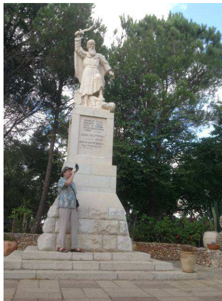
Elijah on Mt. Carmel

Wed. 12/07: Caesarea, Mount Carmel and Megiddo, Hotel in Tiberias