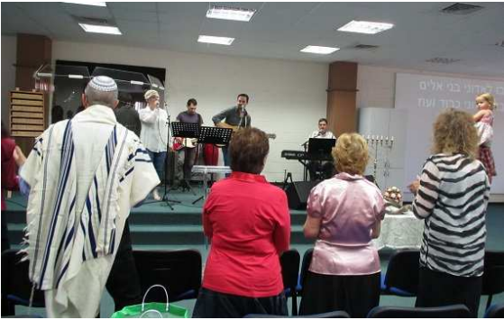
Worshipping with Messianic Believers

12/9 금: 산상수훈의 산, 텔 단, 가이사랴 빌립보, 요단강, 디베랴로 돌아