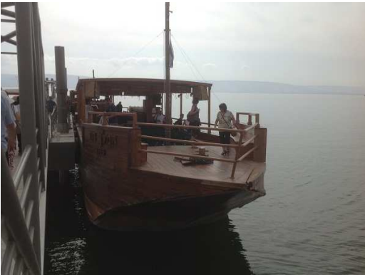
Boat Ride on Sea of Galilee

Fri. 12/09: Mount of Beatitudes, Tel Dan, Caesarea Philippi, Jordan River, back to Tiberias