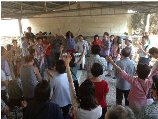
Worship at Shepherd's Field Bethlehem