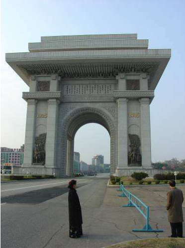
Arch of Triumph, Pyongyang

깊은 어두움과 두려움이 현존하는 지역에서, 우리는 우리의 영광스러운 주님이 이사야 62장의 약속처럼 그 분 자신과 자신의 성, 예루살렘을 회복시키고, 동방의 예루살렘인 평양을 회복시켜 세상을 놀라게 하실 것들을 기대합니다.