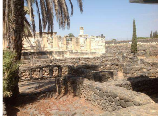
Capernaum: Synagogue, Peter's House

12/8 목: 베드로의 집, 가버나움, 갈릴리 보트 타기, 가나, 나사렛, 디베랴로 돌아