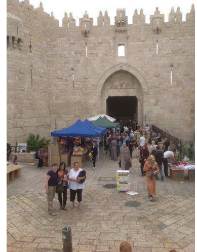
Damascus Gate, Jerusalem