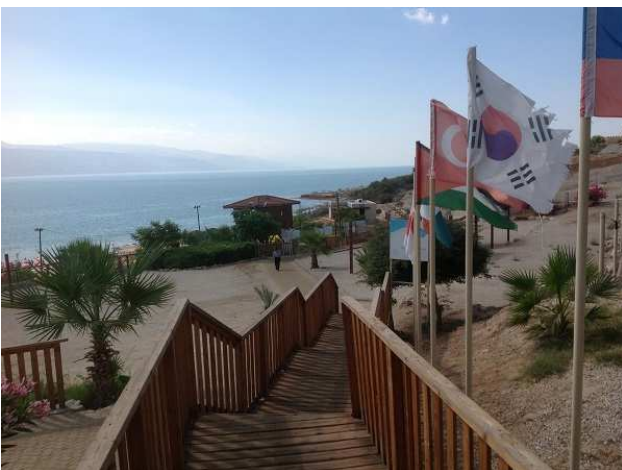
The Dead Sea

12/13 화: 베데스다 연못, 비아 돌로로사, 성전 서쪽 벽(통곡의 벽)