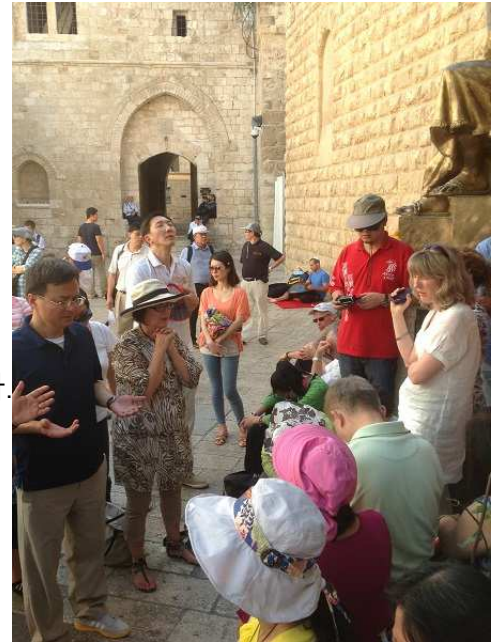
Outside David's Tomb and the Upper Room

매력적으로 보이는 성경의 땅은, 실제로는 훨씬 더 그렇습니다. 한국의 치유와, 중동의 회복을 위해 기도하며 그 땅을 걷는 깊은 중보의 시간이 될 것입니다. 각 지역을 방문하여 중보기도의 시간을 갖고, 하나님의 음성에 귀 기울이는 시간을 갖으려고 합니다.