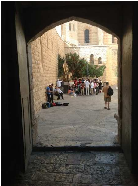
Prayer outside David's Tomb